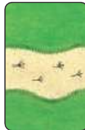
9 cartes de parcours