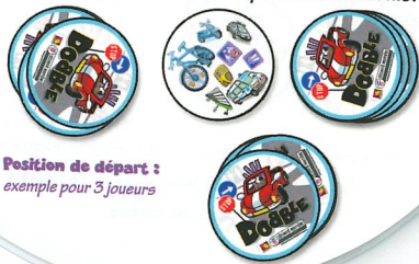
Position de départ : exemple pour 3 joueurs